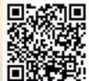
แบบคำขอบริจาค