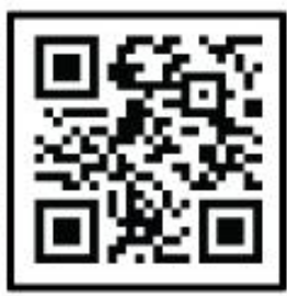
QR Code บริเวณชานชาลา สถานีรถไฟฟ้า MRT

คำแนะนำในการเดินทางสำหรับผู้เดินทางด้วยรถไฟฟ้า MRT 1. ลงสถานีศูนย์วัฒนธรรม ออกประตูที่ 1 หรือ 4 2. เดินตรงมาประมาณ 500 เมตร 3. เดินขึ้นสะพานเชื่อมเข้าสู่อาคารไซเบอร์เวิลด์